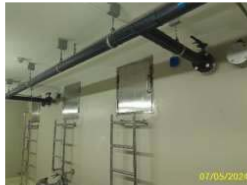
ถังเก็บน้ำใต้ดิน อาคาร B