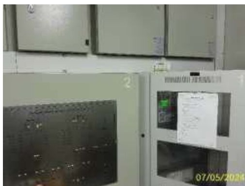
แผงควบคุมระบบแจ้งเตือนอัคคีภัย