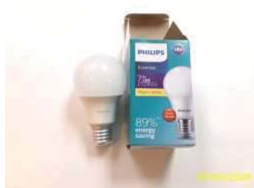
การใช้หลอดไฟ LED แบบประหยัดพลังงาน