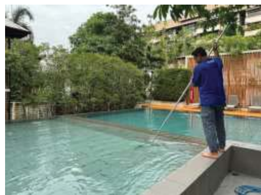
การทำความสะอาดสระว่ายน้ำ