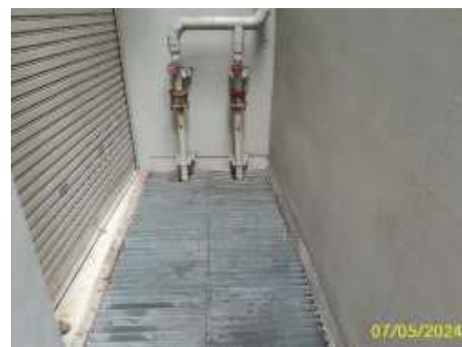
ระบบระบายน้ำในอาคาร