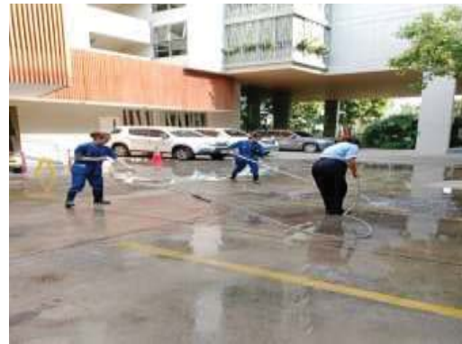
การล้างทำความสะอาดถนนในโครงการ