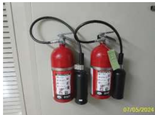
ถังดับเพลิงเคมี