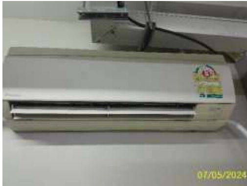
อุปกรณ์ไฟฟ้าชนิดประหยัดไฟเบอร์ 5