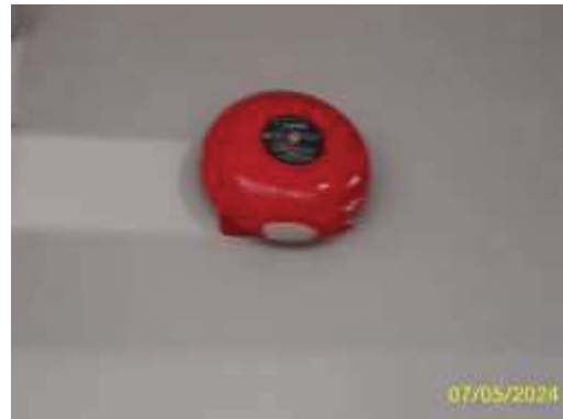
อุปกรณ์แจ้งเหตุเพลิงไหม้ด้วยเสียง (Alarm bell)