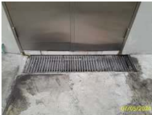
รางระบายน้ำเสียห้องพัสดุโดยรวม