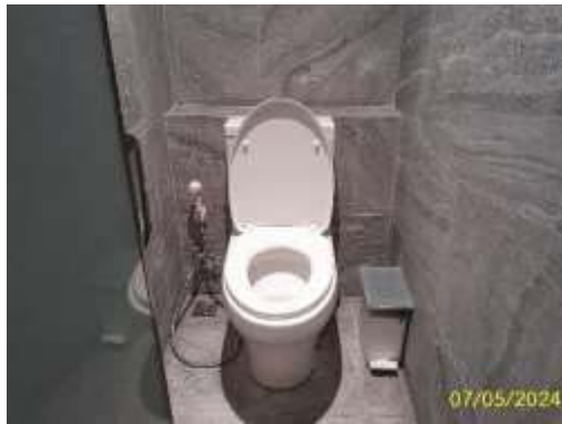
สุขภัณฑ์ประหยัดน้ำ