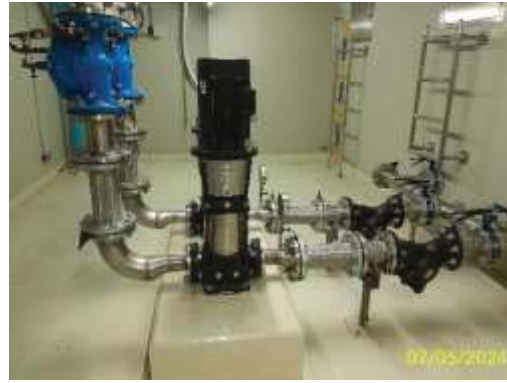
ระบบจ่ายน้ำชั้นใต้ดินอาคาร B