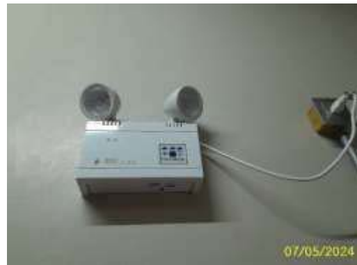
ไฟส่องสว่างฉุกเฉิน