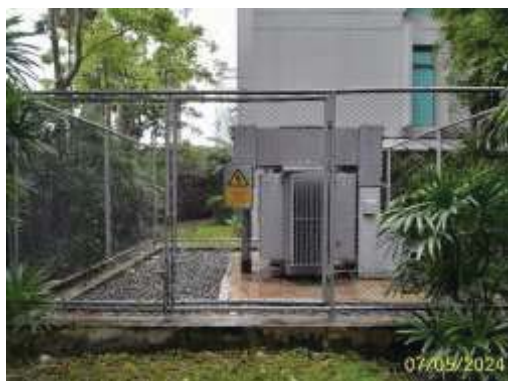
หม้อแปลงไฟฟ้า