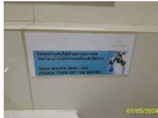
การรณรงค์การประหยัดน้ำ