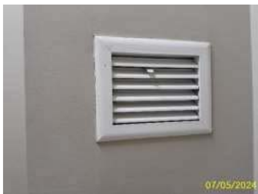
ระบบระบายอากาศห้องพักมูลฝอยประจำชั้น