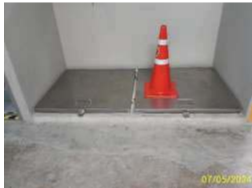
ถังเก็บน้ำใต้ดิน อาคาร A