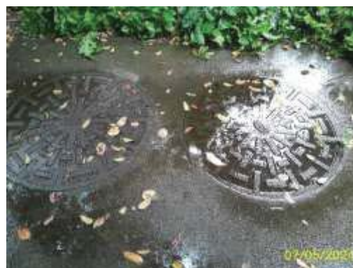
บ่อหน่วงน้ำฝนของโครงการ