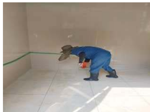
การทำความสะอาดห้องพัสดุโดยรวม