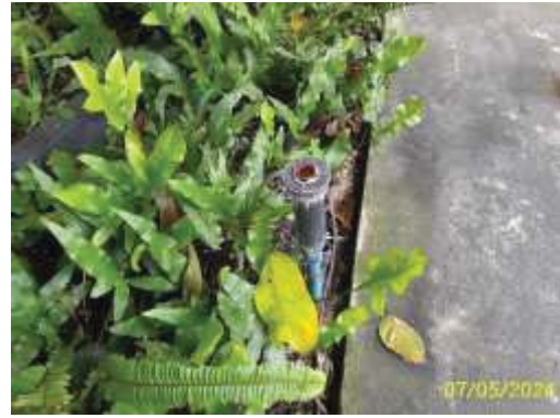
หัวสเปรย์รดน้ำต้นไม้