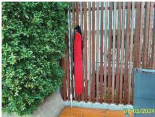
โฟมและไม้ช่วยชีวิต