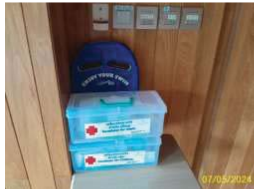
เครื่องช่วยหายใจสำหรับเด็กและผู้ใหญ่