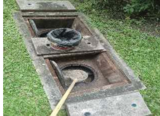
การตักไขมันออกจากระบบบำบัดน้ำเสีย