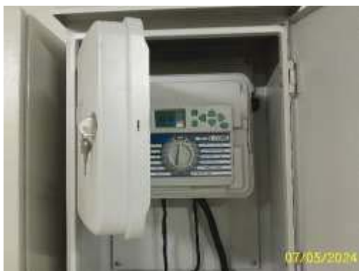
ตู้ควบคุมการรดน้ำต้นไม้