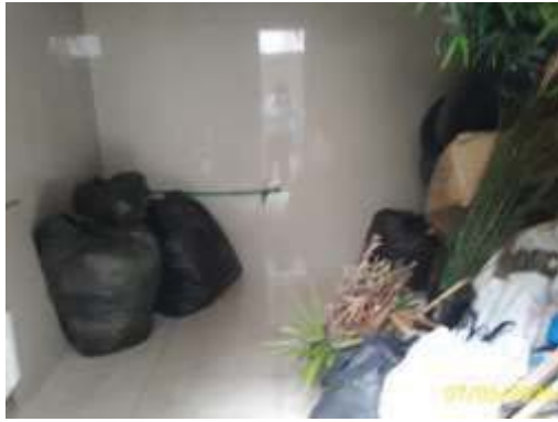
ห้องพัสดุโดยรวมแยกประเภทเปียกและแห้ง