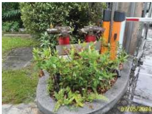
หัวรับน้ำดับเพลิง