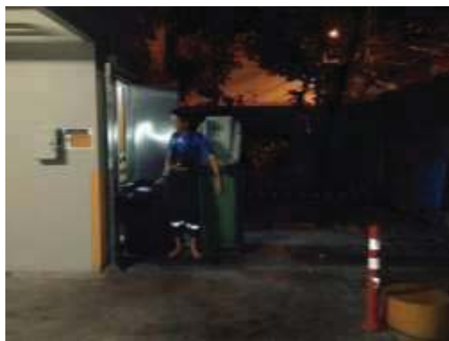
การเก็บข้อมูลโดยสำนักงานเขต