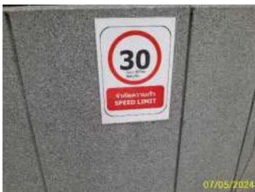
ป้ายจำกัดความเร็ว