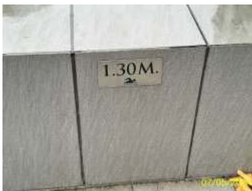
ป้ายบอกความลึกของสระว่ายน้ำ