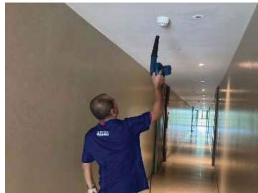
ตรวจเช็คอุปกรณ์ระบบป้องกัน แจ้งเตือนและระงับอัคคีภัย