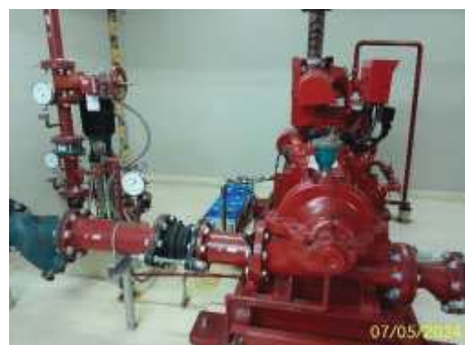
ภาพที่ 2.2-8 (ต่อ) การจัดการระบบอัคคีภัย