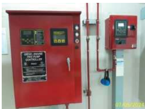
ระบบปั้มน้ำดับเพลิง