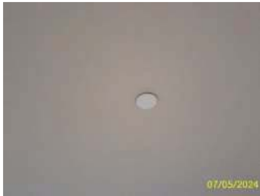
หัวกระจายน้ำดับเพลิงอัตโนมัติ