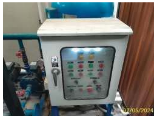
ปั๊มบอร์ดนํ้าต้นไม้