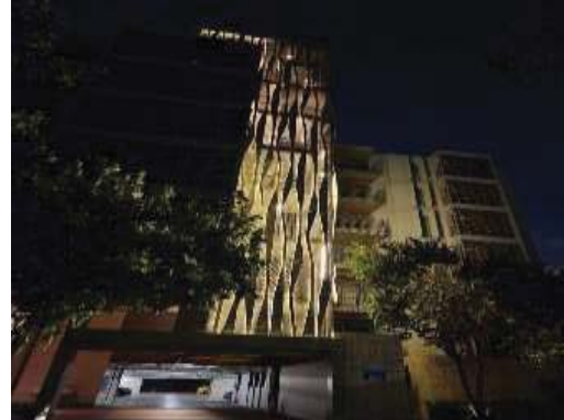
ไฟส่องสว่างและเจ้าหน้าที่อำนวยความสะดวกในช่วงกลางคืน