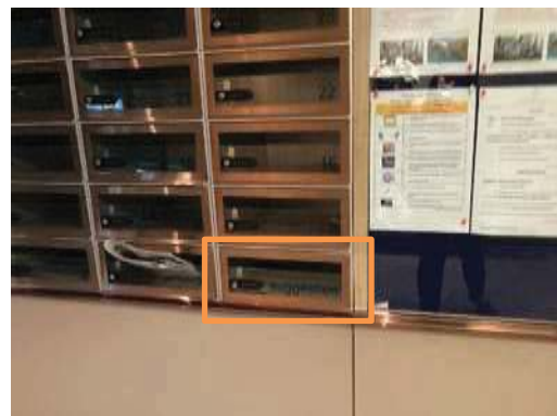
ช่องทางรับเรื่องร้องเรียน