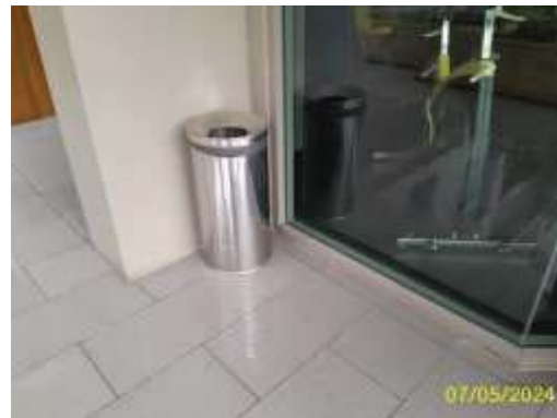
ถังรองรับมูลฝอยบริเวณพื้นที่ส่วนกลาง