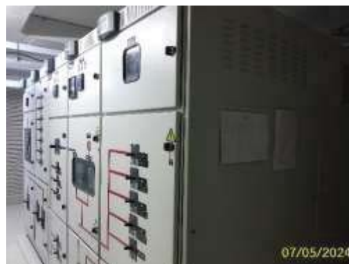
ตู้ควบคุมไฟฟ้าหลัก (MDB)