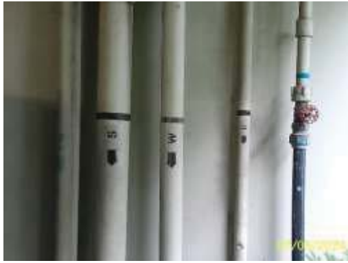
ท่อรวบรวมน้ำเสีย