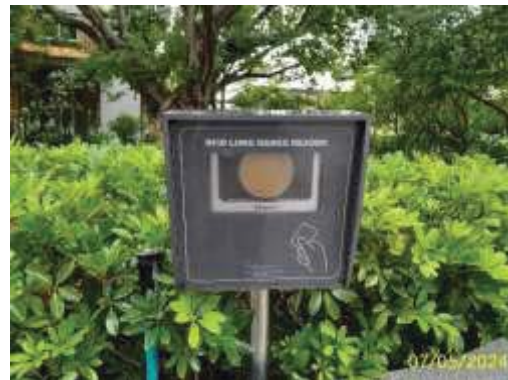
ระบบลู่วัฒนควบคุมการเข้า-ออกโครงการ