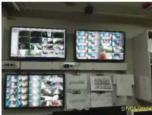
ระบบกล้องวงจรปิด CCTV