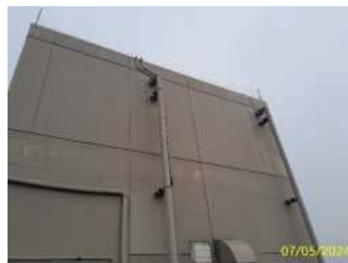
ถังเก็บน้ำชั้นหลังคา อาคาร B