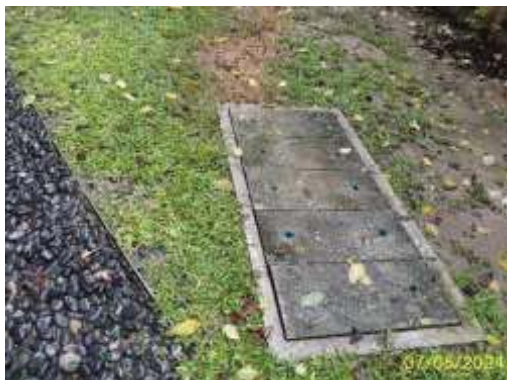
ระบบบำบัดน้ำเสียของอาคาร B