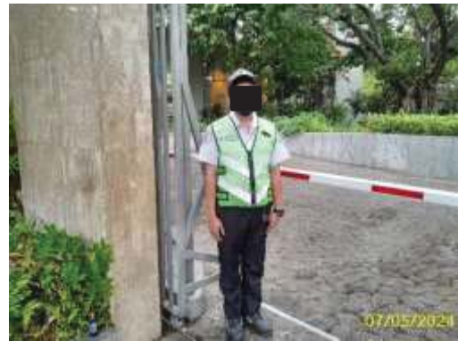
เจ้าหน้าที่ รปภ. หน้าโครงการ