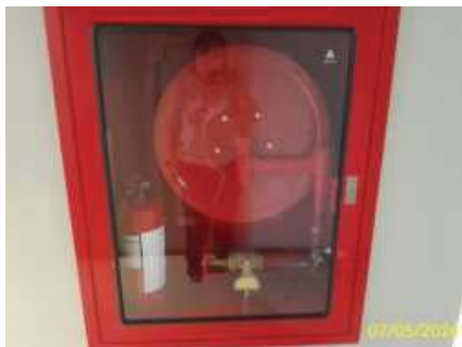
ตู้เก็บสายฉีดน้ำดับเพลิง