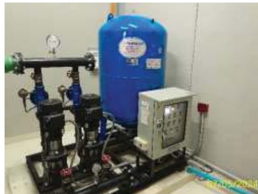
ระบบจ่ายน้ำชั้นหลังคาอาคาร B