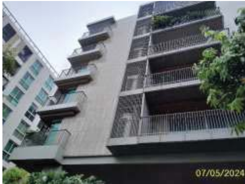
ระเบียงกันตก