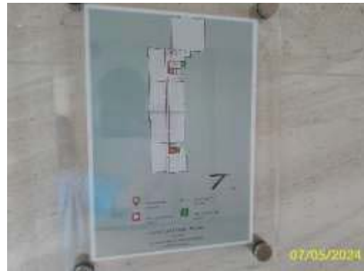
แผนผังเส้นทางหนีไฟ