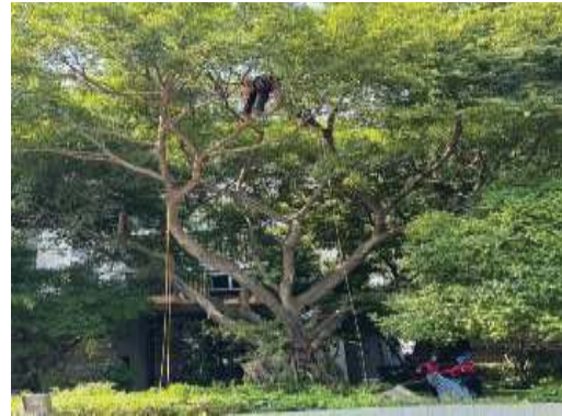
การดูแล บำรุงรักษาพื้นที่สีเขียว