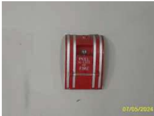
อุปกรณ์แจ้งเหตุเพลิงไหม้แบบมือกด