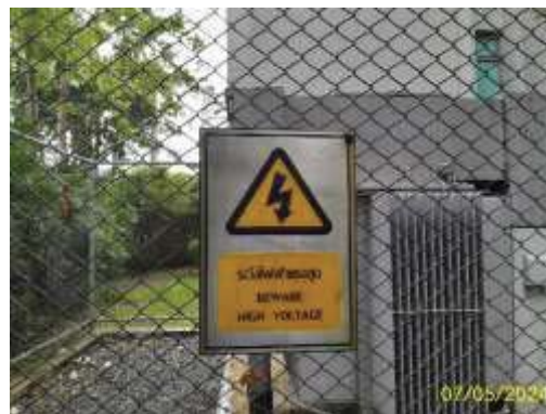
ป้ายเตือน “ระวังไฟฟ้าแรงสูง”