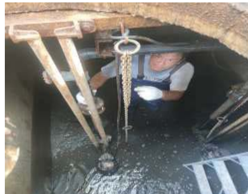
การดูแลบำรุงรักษาระบบบำบัดน้ำเสีย