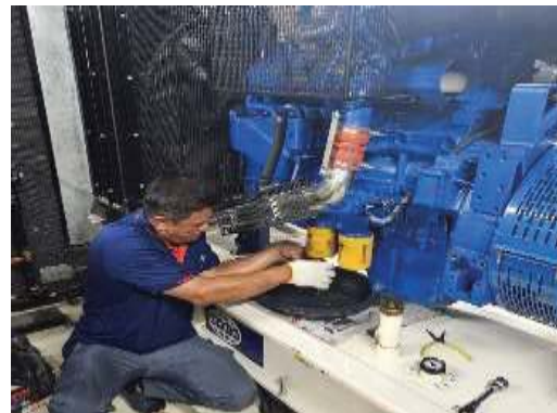
การตรวจเช็คระบบไฟฟ้า