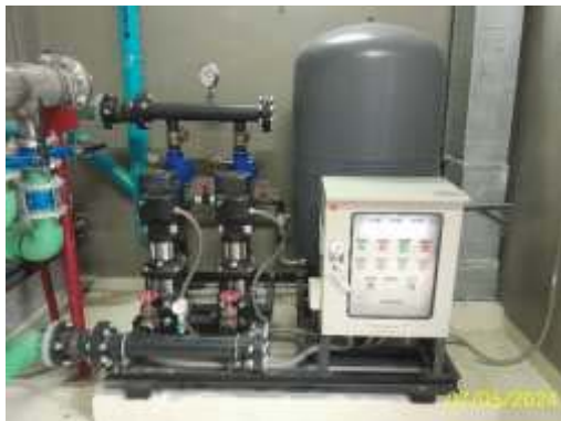
ระบบจ่ายน้ำชั้นหลังคาอาคาร A