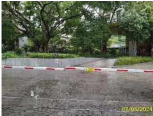
ทางเข้า-ออกโครงการ