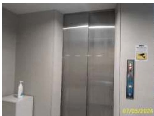
ลิฟต์ดับเพลิง