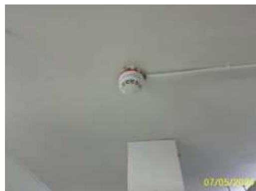
อุปกรณ์ตรวจจับควัน (Smoke Detector)