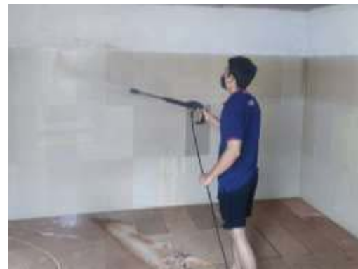
ภาพที่ 2.2-4 (ต่อ) การบริหารจัดการระบบน้ำใช้