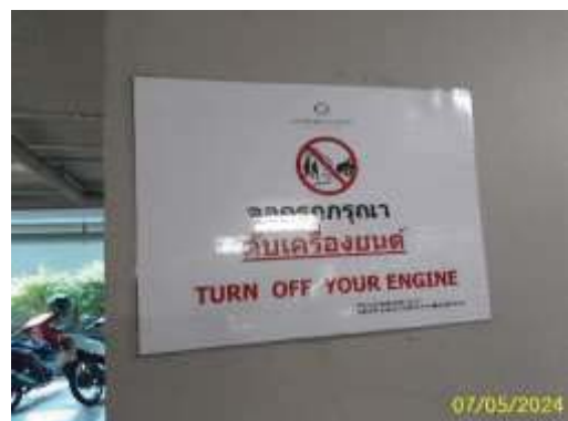
ป้ายเตือน “ขอความร่วมมือ ปิดเครื่องยนต์”