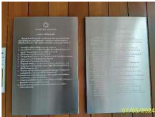
ป้ายแสดงระเบียบการใช้สระว่ายน้ำ