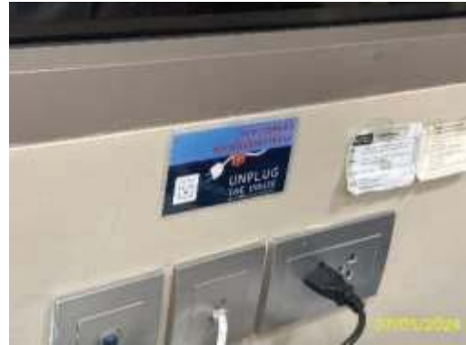
ป้ายรณรงค์การประหยัดพลังงาน