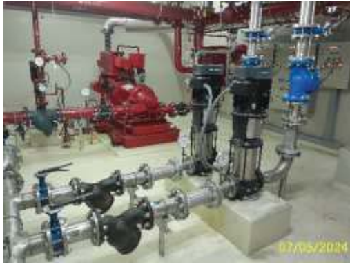
ระบบจ่ายน้ำชั้นใต้ดินอาคาร A