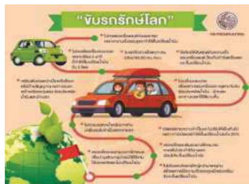
การประชาสัมพันธ์เกี่ยวกับการจราจร