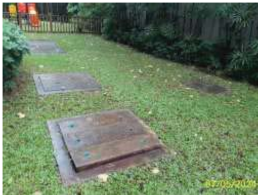
ระบบบำบัดน้ำเสียของอาคาร A