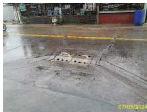
ท่อระบายน้ำสาธารณะหน้าโครงการ