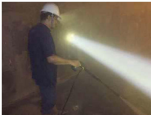
การทำความสะอาดถังเก็บน้ำใช้