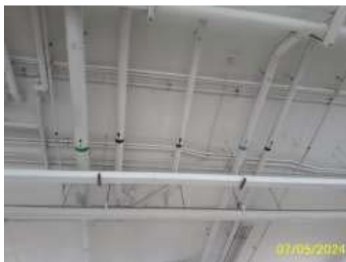
ท่อรวมน้ำเสีย