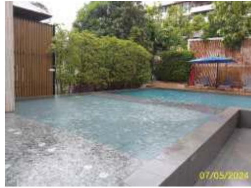
โครงสร้างและบริเวณโดยรอบสระว่ายน้ำ