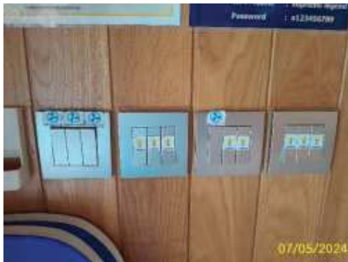
สวิตช์เปิดแบบแยกเฉพาะจุด