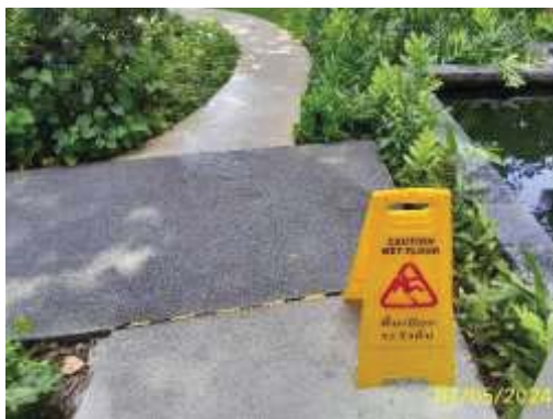
ป้ายเตือน “โปรตระวังพื้นลื่น”