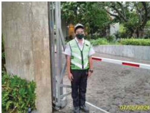
เจ้าหน้าที่รักษาความปลอดภัย