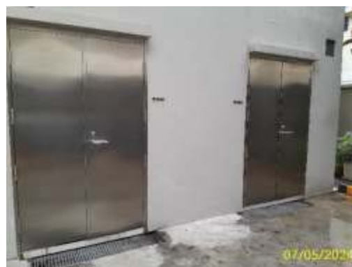
ห้องพักมูลฝอยรวม