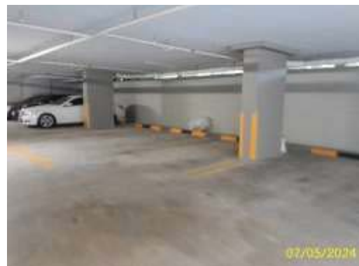
ทางเดินรถและพื้นที่จอดรถภายในโครงการ