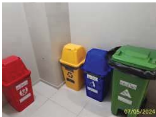
ห้องพักมูลฝอยประจำชั้น