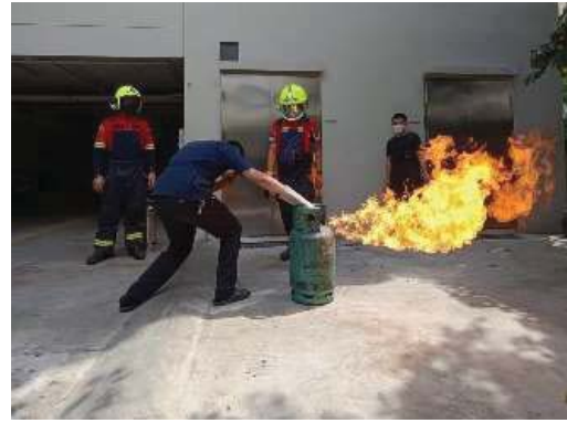
การอบรมวิธีการใช้อุปกรณ์ดับเพลิงและซ้อมอพยพหนีไฟ