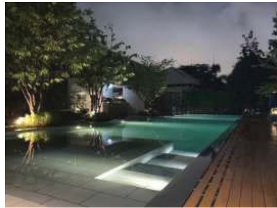
ไฟส่องสว่างบริเวณสระว่ายน้ำในเวลากลางคืน