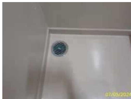
ท่อระบายน้ำห้องพักมูลฝอยประจำชั้น