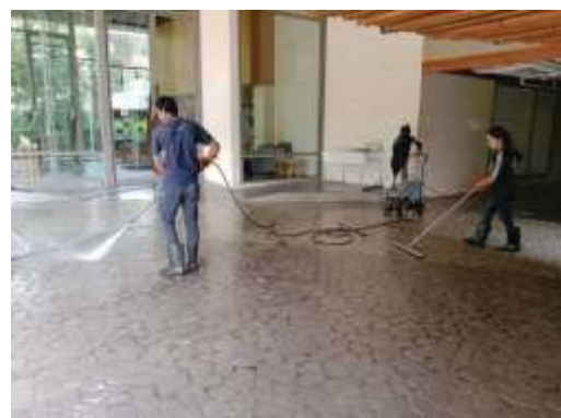
การทำความสะอาดพื้นที่ส่วนกลาง