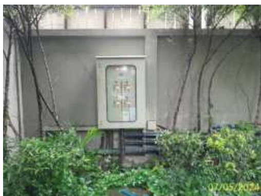
ตู้ควบคุมระบบระบายน้ำ