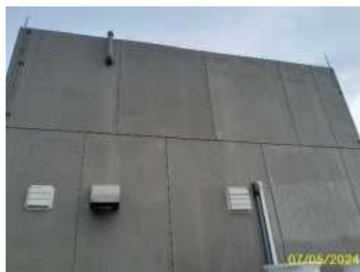
ถังเก็บน้ำชั้นหลังคา อาคาร A