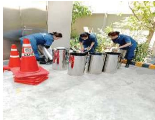
การทำความสะอาดถังรองรับมูลฝอยและห้องพัสดุโดยรวมประจำชั้น