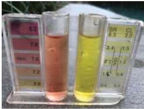
การตรวจวัด pH และคลอรีนประจำวัน