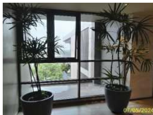
การออกแบบเพื่อใช้แสงและการระบายอากาศโดยวิธีธรรมชาติ