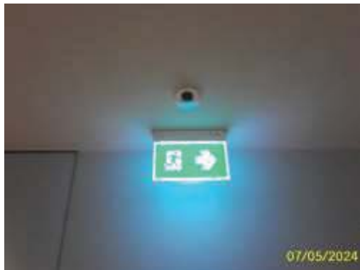
ป้ายไฟแสดงเส้นทางหนีไฟ