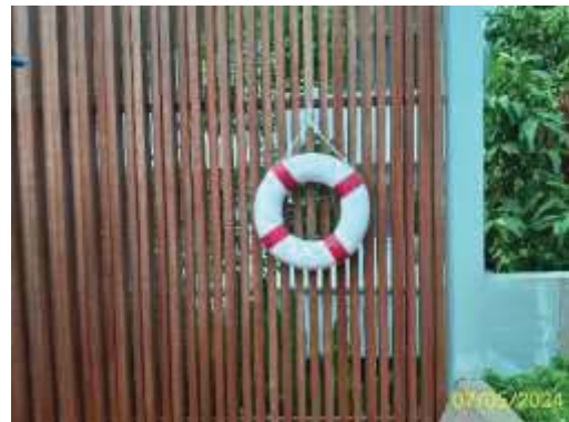
ห่วงชูชีพ