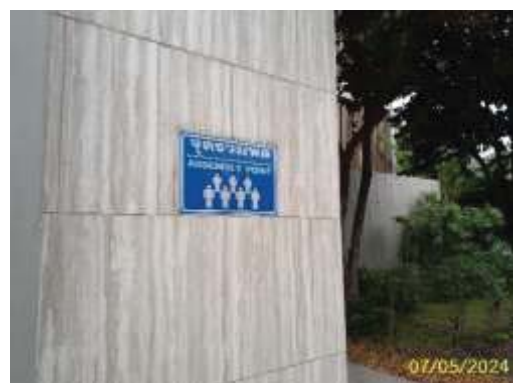
จุดรวมพล