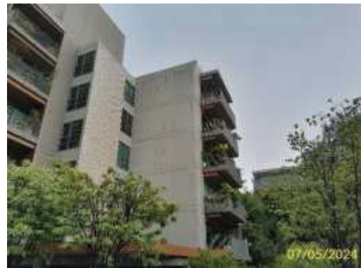
การปลูกต้นไม้บริเวณระเบียงห้องพัก