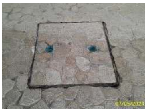
ท่อระบายน้ำและบ่อพักน้ำรอบอาคาร