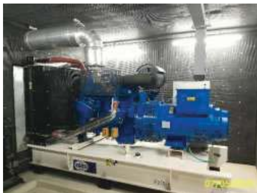
เครื่องกำเนิดไฟฟ้าสำรอง