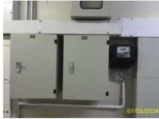
มิเตอร์ไฟระบบบำบัดน้ำเสีย